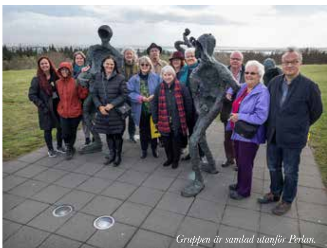
Gruppen är samlad utanför Perlan.