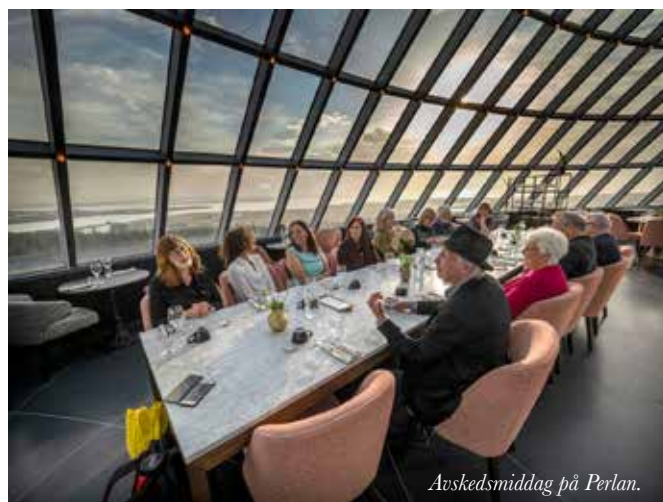
Avskedsmiddag på Perlan.