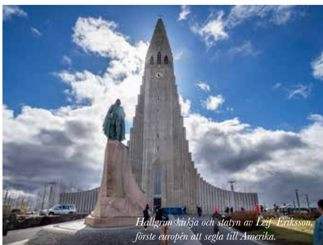
Hallgrímskirkja och statyn av Leif Eriksón, förste europén att segla till Amerika.