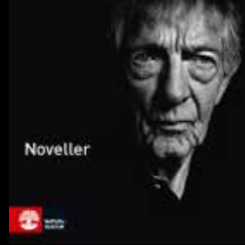
Kjell Askildsen