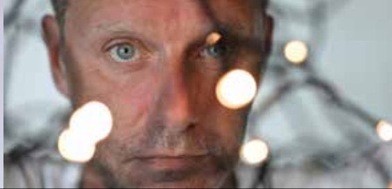
John Ajvide Lindqvist